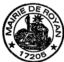
Didier QUENTIN Portable : 06 11 30 19 20

Assemblée Nationale 126, rue de l'Université 75355 PARIS 07 SP Tél. 01 40 63 66 94 - Fax 01 40 63 56 94