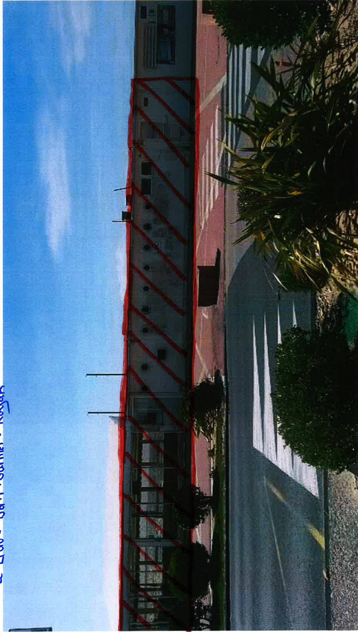
Le Lido - Bd. F. Garnier - Royan