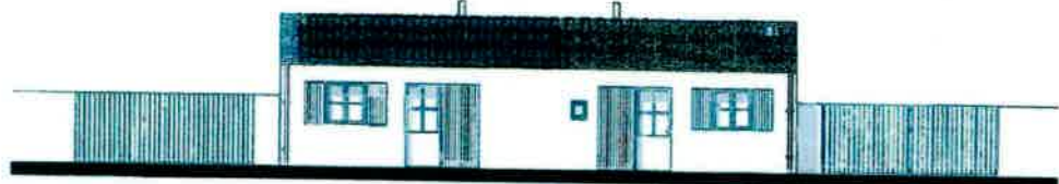
Façade sur rue

Ville de Royan Immobilier Atlantik Aménagement Ville de Royan