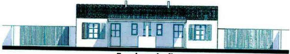
Façade sur jardin