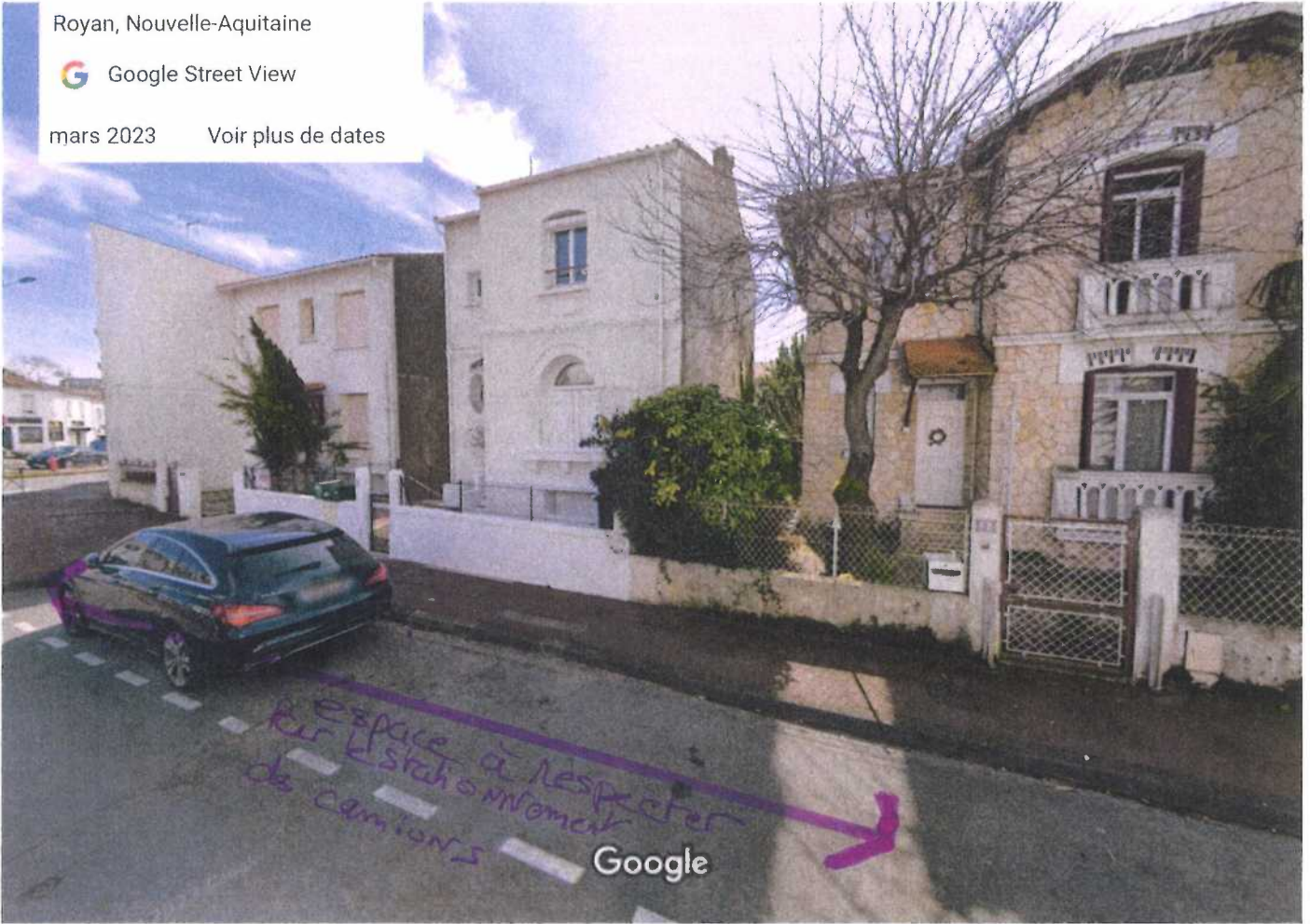
Date de l'image : mars 2023