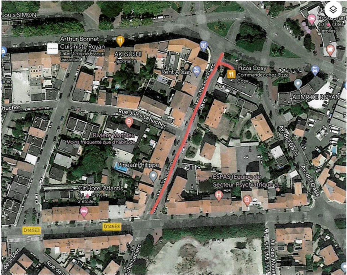
Empiètement des travaux PI du Dr Gantier